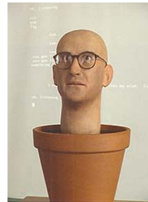
L'art numérique selon Feingold, nouvelle culture humaniste ?

L'art numérique suppose en effet que l'homme et la machine fusionnent pour maximiser le potentiel imaginaire, mental et créateur. Cette démarche est des plus perverses puisqu'elle englobe sa propre contestation. Car l'art numérique a aussi ceci de commun avec l'art contemporain : ses prises de position, si radicales soient-elles, vont toujours dans le sens de l'idéologie qui les favorise, à savoir la démocratie spectaculaire, au service des techno-sciences. S'il est capable de s'interroger (sur la liberté d'expression), voire de revendiquer (le droit d'une minorité par exemple), cet art ne remet jamais en question la légitimité de ses fondements, et accepte a priori l'idée que l'homme doit s'adapter aux impératifs de transparence, de communication, d'hybridation, de mutabilité, etc., soit donc de devenir un post-humain 9 .