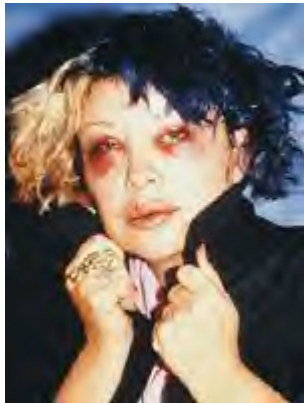
Orlan, artiste modèle : de la mise en scène de la violence conjugale...