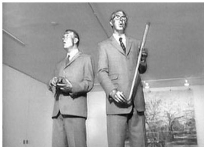
Gilbert et George : un flegme très british...