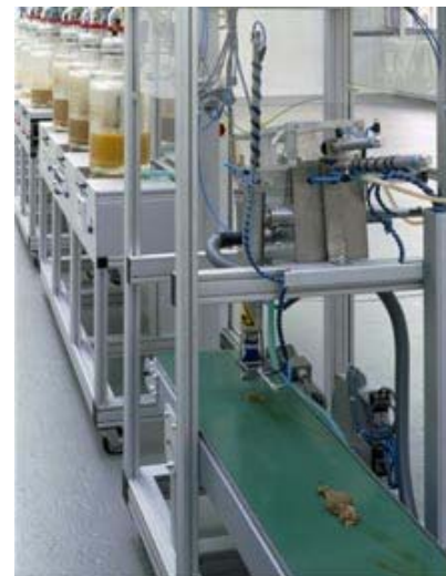
En 2001, grâce à son ingénieuse machine Cloaca, « l'artiste » Wim Delvoye fabrique artificiellement... un authentique caca humain, là où jadis quelques mètres de tripes suffisaient !

Que dire enfin de ceci ? « Je suggère que l'art transgénique est une nouvelle forme d'art basée sur le recours aux techniques de l'ingénierie génétique afin de transférer des gènes synthétiques aux organismes, ou de transférer du matériel génétique naturel d'une espèce à une autre, le tout dans le but de créer des être vivants inédits. La génétique moléculaire permet à l'artiste d'organiser les génomes végétal et animal et de créer ainsi de nouvelles formes de vie. L'essence de cette nouvelle forme d'art est définie non seulement par la genèse et la croissance d'une nouvelle plante ou d'un nouvel animal, mais surtout par la nature de la relation entre l'artiste, le public et l'organisme transgénique. Étant donné qu'au moins une espèce en voie d'extinction disparaît à jamais quotidiennement, je suggère que les artistes puissent contribuer à accroître la biodiversité globale en inventant de nouvelles formes de vie. Il n'y a pas d'art transgénique possible sans responsabilité et sans engagement ferme envers la nouvelle forme de vie ainsi créée. Les