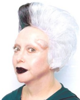
... aux bosses chirurgicalement assistées !

Certes, l'idée de transformer la vie en œuvre d'art n'est pas née d'hier : il suffit de relire Le Dorian Gray d'Oscar Wilde ou À rebours de Huysmans pour s'en persuader. Mais là où cette revendication appartenait il y a un siècle encore à une classe de bourgeois ou rentiers plus ou moins décadents, elle pourrait être aujourd'hui l'apanage de tout un chacun et apparaît, fallacieusement bien sûr, comme un acquis de la démocratie libérale. Finalement, le message de l'art contemporain n'est guère différent que le « Sois toi-même » que la pub et les émissions à grands publics de starisation-minute entonnent de conserve.