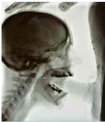
Quand Wim Delvoye passe l'art au rayon X...

Le débat sur la frontière entre art et anatomie a d'ailleurs tout récemment été reposé par le Docteur Von Hagen, plastineur de cadavres 8 . Toute la question reposait sur le fait de savoir si les corps conditionnés – et tous légués, selon les dires du bon Doktorr, par des volontaires – devaient être exposés dans une mise en scène théâtrale. Un homme tenant à bout de bras sa propre