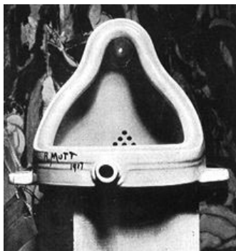
De l'urinw-art de Duchamp...

La figure fondatrice de l'art contemporain, celui qui inaugure, par l'ironie radicale de sa démarche, le brouillage de tous les repères en matière de jugement esthétique, fut Marcel Duchamp. Ses premiers ready made datent de 1913 et apparaissent comme les signes avant-coureurs du dadaïsme. Le plus spectaculaire d'entre eux, en tout cas le plus paradigmatique de sa démarche, est sans doute l'urinoir baptisé Fountain et signé R. Mutt, refusé au Salon des Indépendants en 1917.