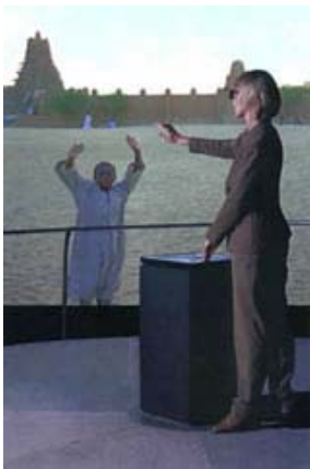
Un bonjour ensoleillé de Tombouctou...

L'installation (car c'est bien ce vocable qui a succédé à celui d'œuvre...) de Michael Nimark Be now here ! (1995-1997) nous semble la plus illustrative et la plus symptomatique de cette tendance. Lisons la très neutre présentation qu'en fait Christiane Paul : « Cet environnement virtuel immersif se compose d'un écran de projection stéréoscopique et d'un plancher pivotant sur lequel se place le spectateur. Celui-ci se retrouve au milieu d'images de sites inscrits sur la liste du patrimoine mondial en péril de l'Unesco (dont Jérusalem, Tombouctou, et Angkor). Muni de lunettes 3D, l'utilisateur choisit une heure et un lieu précis au moyen d'une interface d'accès placée sur un socle. » ( L'art numérique , p. 97).