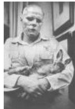
De Joseph Beuys...